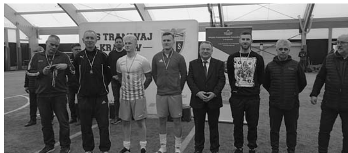
Po dekoracji. W środku Andrzej Kulig za-ca prezidenta Krakowa.