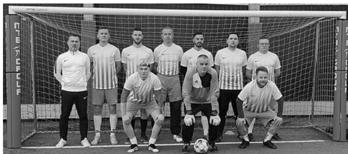
Drużyna ZLK Kraków po heroicznej walce zajęła III miejsce.